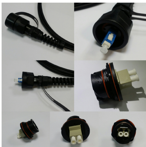
Prise murale en option ELLCRACMURALIP

remplacer le x par la longueur souhaitée de 5m à 200m